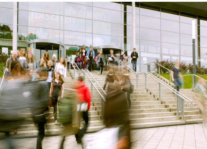
Stand: 05.2019

Universität zu Lübeck Ratzeburger Allee 160 23562 Lübeck