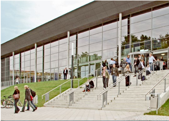
Stand: 05.2016

Universität zu Lübeck Institut für Chemie Ratzeburger Allee 160 23562 Lübeck