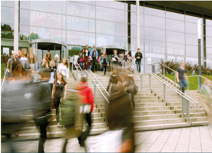
Stand: 05.2018

Universität zu Lübeck Ratzeburger Allee 160 23562 Lübeck