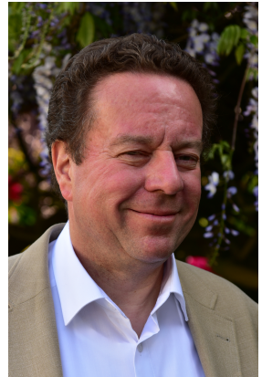
Abbildung: Michael Georg Schmidt