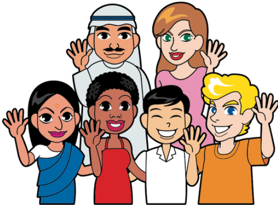
Abbildung: Ihr bekommt neue Kontakte