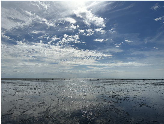
Abbildung: Euer Horizont wird weiter