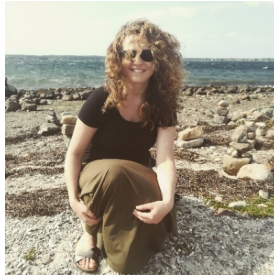
Abbildung: Patrycja Kupiec