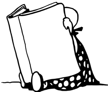
Abbildung: Weil es Euch interessiert