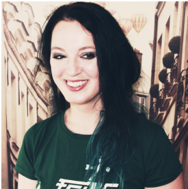
Abbildung: Antje Hänzelmann