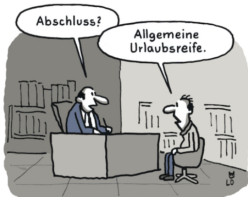
Abbildung: ... Ihr habt gezeigt, dass Ihr engagiert seid