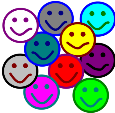
Abbildung: Engagement bringt Spaß